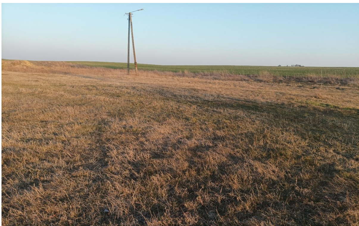
Fotografia 8 Przedmiotowa działka (źródło: zbiory własne, marzec 2022 r.).