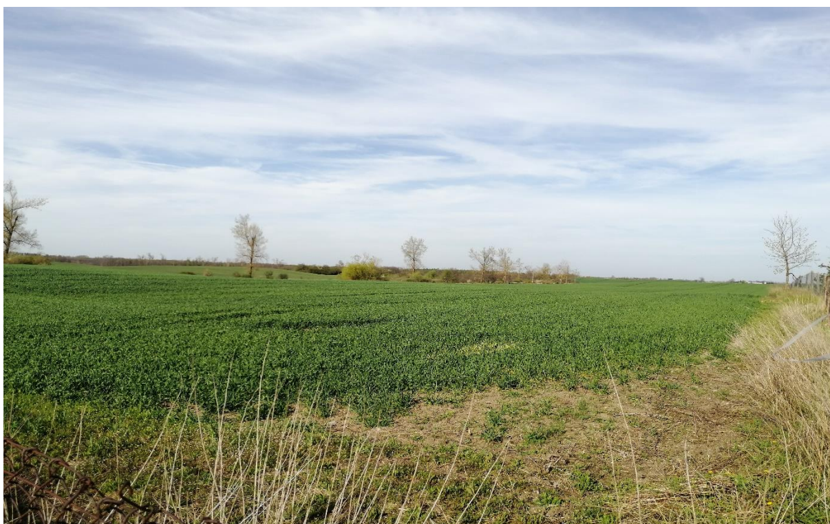
Fotografia 2 Widok na przedmiotową działkę (źródło: zbiory własne, maj 2021 r.).