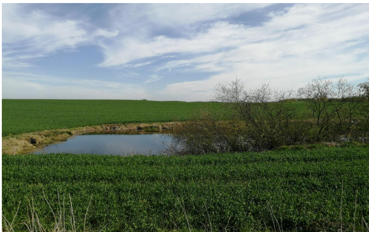
Fotografia 4 Zbiornik wodny występujący w sąsiedztwie przedmiotowej inwestycji.