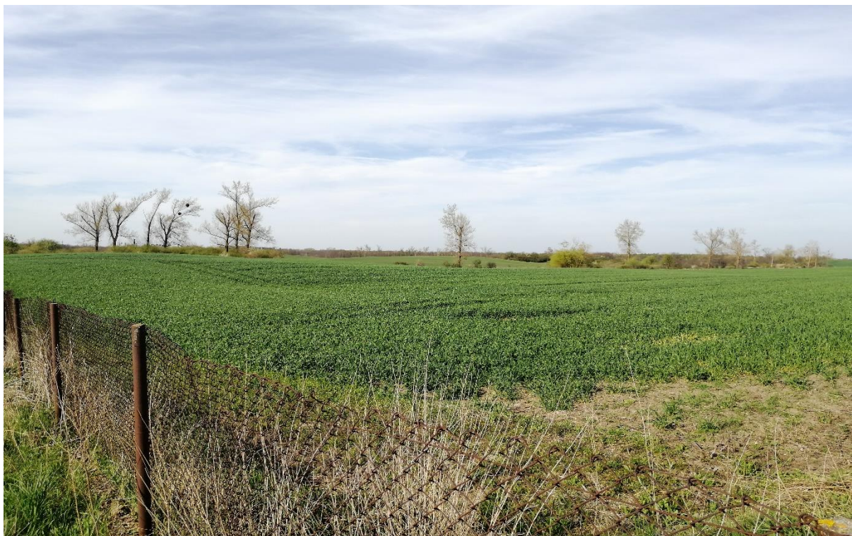
Fotografia 1 Widok na przedmiotową działkę.