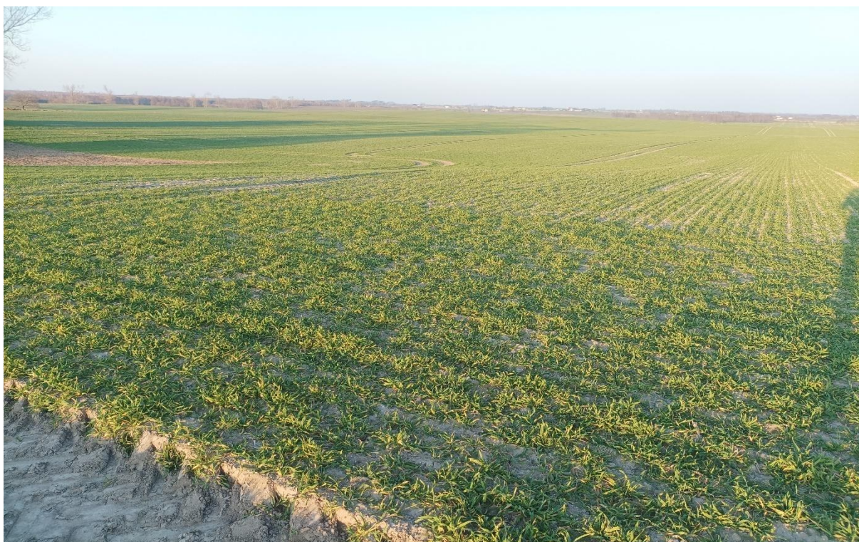
Fotografia 6 Przedmiotowa działka (źródło: zbiory własne, marzec 2022 r.).