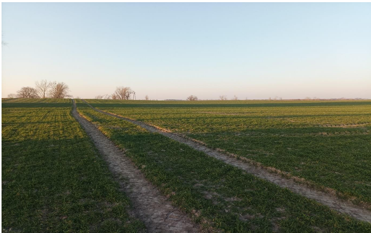
Fotografia 7 Przedmiotowa działka (źródło: zbiory własne, marzec 2022 r.).