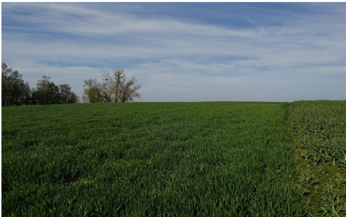
Fotografia 3 Widok na przedmiotową działkę.