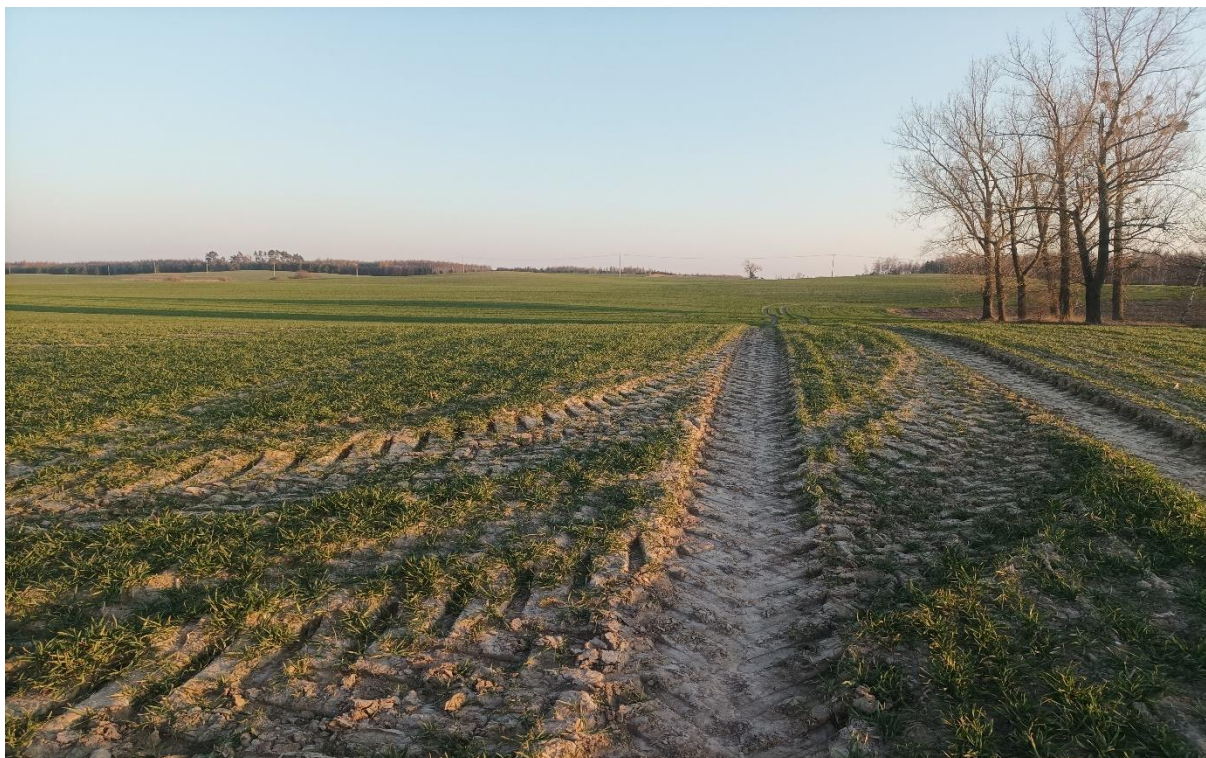
Fotografia 5 Przedmiotowa działka.