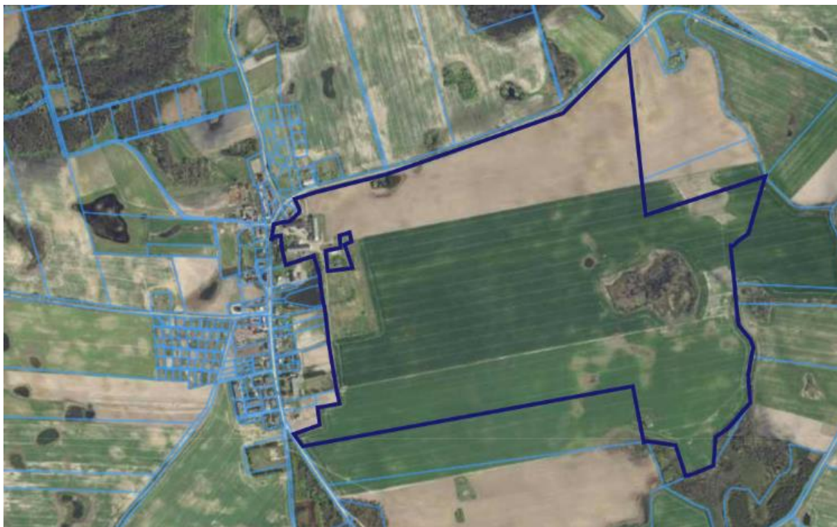
Rysunek 2. Lokalizacja przedmiotowej działki.